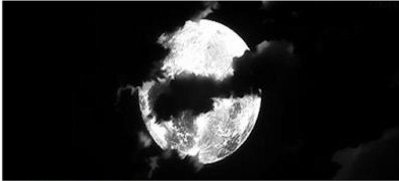
Τα μυστικά του φεγγαριού

5 Η Σελήνη, που πότε μεγαλώνει και πότε μικραίνει, πότε φωτίζει και πότε σβήνει, ήταν ένα μεγάλο μυστήριο για τους αρχαίους λαούς. Στην ιστορία που διάβασες πώς ταξιδεύουν οι ήρωες στη Σελήνη και πώς περιγράφουν τον πλανήτη και τη ζωή πάνω σ' αυτόν.