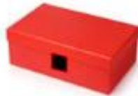
κουτί παπουτσιών με μικρό παράθυρο

2. Συζητήστε πώς θα χρησιμοποιήσετε το κουτί με το μικρό παράθυρο, για να ανακαλύψετε ποια από τα αντικείμενα εκπέμπουν φως και ποια όχι.