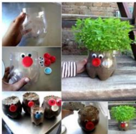
ΦΑΤΣΟΥΛΕΣ ΜΕ ΜΑΛΛΙΑ...ΠΟΥ ΜΕΓΑΛΩΝΟΥΝ