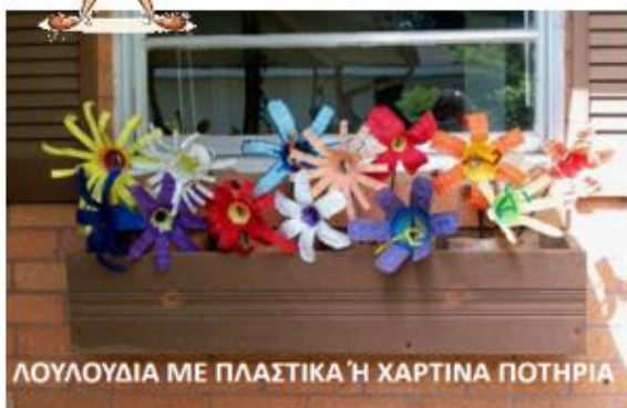
ΛΟΥΛΟΥΔΙΑ ΜΕ ΠΛΑΣΤΙΚΑ Ή ΧΑΡΤΙΝΑ ΠΟΤΗΡΙΑ