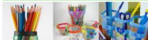
ΜΟΛΥΒΟΘΗΚΗ ΜΕ ΠΛΑΣΤΙΚΟ ΜΠΟΥΚΑΛΙ