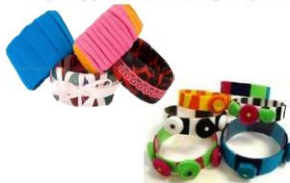
ΒΡΑΧΙΟΛΙΑ ΑΠΟ ΚΟΜΜΑΤΙΑ ΠΛΑΣΤΙΚΟΥ ΜΠΟΥΚΑΛΙΟΥ ΜΕ ΥΦΑΣΜΑΤΑ ΚΑΙ ΚΟΡΔΕΛΕΣ